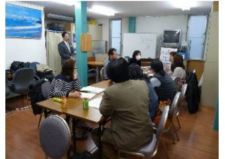
↑ 管理者クラスのリダー研修 ← 福祉用具・入社時の介護研修