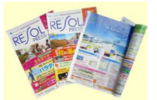
ライフサポート倶楽部ではホテルやゴルフ等のレクリエーションからショッピング迄の幅広いサービスを展開！！