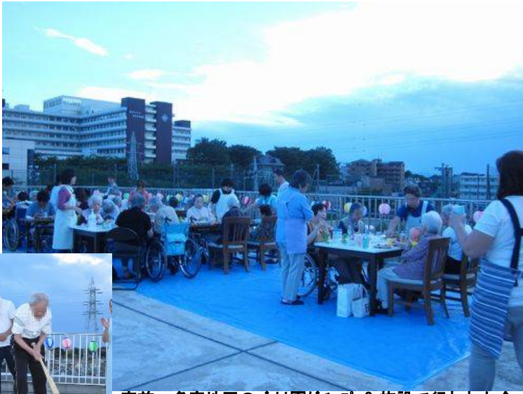
宮前、多摩地区のバナナ園グループ 3 施設で行われた合同納涼祭！今年は過去最大の参加者と盛り上がりました！！

2010年5月川崎市宮前区菅生の地にオープンして以来、認知症介護のサライトとして地域に溶け込みながら5度目の夏を迎えた高齢者介護施設グループホーム「バナナ園生田の杜」。8月23日の土曜日、この「バナナ園生田の杜」「バナナ園生田の泉」今年には「バナナ園生田ヒルズ」も参加し3つのホーム合同で恒例の夏のイベント「2014年生田納涼祭」が催されました。ご入居者様、そしてご家族様、そしてスタッフにとっても心待ちの行事になりました。普段は静かで落ち着いた施設もこの日は大賑わいの一日、スタッフ総出で提灯や飾り付けが、そして特設の焼きそば屋さん、ワンクルト屋さん、焼き鳥屋さんも登場！！今年は、スリッパ割りに花火も企画しました！707-には東京音頭や炭坑節がながれ否が応でも盛り上がりすぎてしまいます。ご入居者様のご家族M様は「毎月父の面会に来ますが、ここで炭坑節を聴くとは思いませんでした（笑）。でも幼い頃父に手を引かれ盆踊りに行ったことを思い出します。父の嬉しそうなお顔をみて入居して本当に良かったと思うのです。」管理者の増田は「この施設では＜納涼祭＞の他にも様々なイベントを企画しますがご家族をお呼びしてのイベントは如何にして親子水入らずの空間と＜懐かしさ＞を演出できるかが課題。昨晩はスタッフ総出で飾り付けや準備に大忙しでしたが、皆様が『家族の風景』を思い出して頂ければ、それでいいと思うのです。」と語ってくれた。入居者様とご家族様が、『家族に戻った会話と笑顔の時間』を過ごしていた様子が、随所に伺えた事は、スタッフにとってもほんとうに嬉しい事。CMのキャッチコピーではないですが「すべては、お客様の『笑顔！』のために」の心境です。