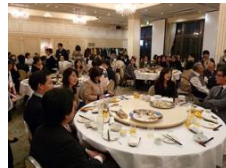
社員が一同に会するクリスマスパーティーは豪華景品が当たるBINGO!ゲームが人気！！