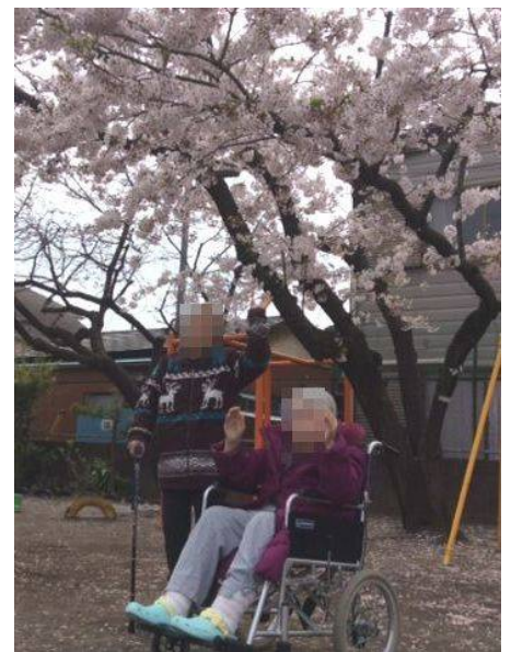
枯れ木に花を咲かせましょう！ 満開の桜の木の下で思わず万歳!!