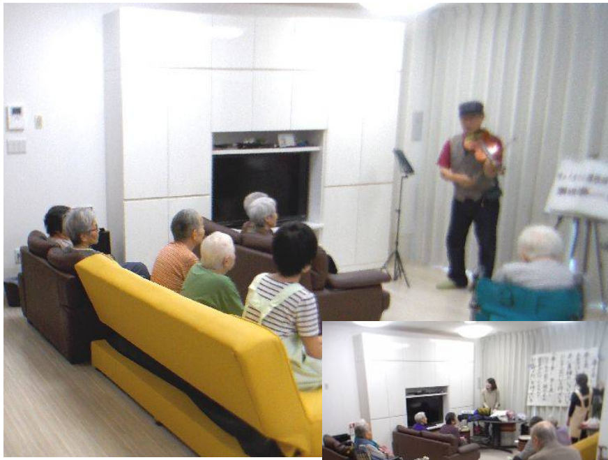
↑パートの伴奏に合わせてコーラス練習 音楽療法、歌詞を見ながら大きな声で→

取組みのきっかけは2ヶ月に一度の「音楽療法」でした。この施設では音楽を聴いたり演奏したりすることによって心身の健康の回復、向上をはかる「音楽療法」をアクティビティの一つとして取り入れ、音楽療法士の先生の指導で楽器を演奏したりピアノ伴奏で歌を歌ったり、体を動かしたりして楽しんでいます。ある日この音楽療法の最中に「皆さんほんとうに歌が上手だからチャリティコンサートに出演したら」と言うスタッフの何気ない一言で盛り上がり、夢を叶えるプロジェクトとして、「のんびり～す等々力合唱団(仮)」としてコンサート出演を目指し、先月より練習をスタートしたのです。あわせて第1回のチャリティコンサートにも出演して頂いたボランティアのパート演奏者の方も、このプロジェクトに参加して頂き伴奏をして頂いています。実は「コーラス」や「音楽療法」の他にもこのグループホーム「のんびり～す等々力」ではプロの女流狂言師を招いての「狂言教室」や「バレとピアノの集い」など、音楽や芸能を積極的に認知症の介護やケアに取り入れています。のんびり～す等々力はまさに「音楽の街川崎」にふさわしい、明るく笑顔で溢れるグループホームです。お近くにいらした際は是非お立ち寄り下さい。