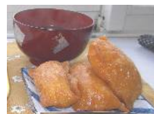
桜もいけどやっぱり本音は花よりお稲荷さん！

ホームの前、団地の敷地内にも桜の木があります。保育園の桜たちとは違い、1本ポツと立っています。でも堂々とした木で咲き方も鮮やか、かつ力強い。そんな感じでこの桜の木は第2バナナ園を目の前から見守っています。歩行が難しい方でもせめてここまでは行くことができます。この桜の木が「おいで！」と言っているのでしょうか。青く澄みきった空に輝く桜。目と心にいつまでも焼き付けられますように。また来年！