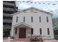
バナナ園武蔵小杉

7/22（土）は小学生のお子様向けに「バナナ園フレンドキッズ」という子供職業体験を行います。この新聞の記事にもありますね！お申込みが必要ですからぜひご連絡ください。