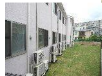
お庭はこんな感じ