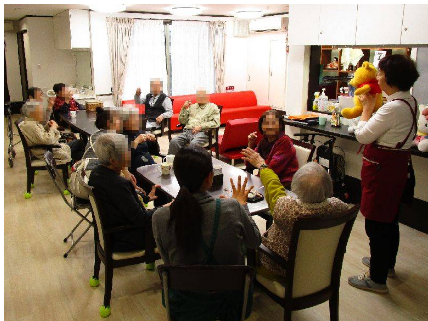
Winnie-the-Poohのプーさんと「後出しじゃんけん」に興じる図。アツくなるのは入居者様よりも「真昼のギャンブル」ことスタッフの方。

横浜市中区のグループホーム「バナナ園横浜山手」では毎日15時のお茶の時間の前後にはレクリエーションの時間を設け、入居者様と楽しい時間を過ごすことが日課になっています。今回はそんなレクリエーション風景をご紹介します。内容は施設スタッフが日々趣向を凝らし考えたオリジナル・レクリエーション。認知症の方々には難しく、かといって余りやさしすぎてもダメ。シンプルで勝ち負けがはっきりわかる「かるたとり」や「後出しじゃんけん」「トランプ」等、やはり頭を使うゲームに人気が集まり、「難しいけど、楽しかった」「またやりたい」と“遊ぶ”だけではなく、期待を持って参加して下さっている姿があります。特に「かるたとり」「トランプ」は勝負ゲームのため、皆時間を忘れ、白熱してしまう姿も見受けられます。私たちスタッフも対戦相手として参加させていただく事もあるのですが、入居者様たちに負けじとついつい真昼のギャンブルになってしまいます。昨年10月から、この2月までの間、食用油でお馴染みの日清オリーブグループ(株)と共にアルツハイマー病の周辺症状に効果があると言われている「MCT(中鎖脂肪酸油)」についての研究に取り組み、中鎖脂肪酸油の摂取前後のレクリエーション時の様子を撮影させていただき、解析を進め、本年6月に新潟市で開催される「日本認知症学会」に共同研究という形で学会発表も予定しています。ゲーム以外では、やはり歌詞カードを見ながら入居者様と共に合唱をする“歌の時間”がとても人気です。選曲はその都度、入居者様のリストで決定しているのですが、時に職員が歌詞を間違え笑いが飛び交う時間もあれば、歌い終わると昔を思い出して涙ぐむ方もいらっしゃいます。音楽にはその方の歩んできた人生の思い出も沢山詰まっているのですね、歳はとってもやはり「No MUSIC NO LIFE」です、時には歌の時間を通してその方の人生ストーリーを聞かせていただける時間にもなるのです。歌の時間が終わると、入居者様から「また歌いたい、ありがとう」と言ってくる言葉に職員もほっこりした気持ちになっています。特に新しく入居された方に一日も早く施設での生活に馴染んでいただき、楽しく安心して過ごしていただけるためにもレクリエーションの時間をとても大事にしています。今後も入居者様に楽しんで生活して頂ける様、笑顔と笑いの絶えない環境づくりを目指し、レクリエーションに取り組んでいきたいと思ひます。<「バナナ園横浜山手」のレクリエーションの様子が地上波TVにて紹介されました> ◆2017年12月8日 on air ゆうがたサテライト(TX テレビ東京) http://www.tv-tokyo.co.jp/mv/you/feature/post_145815/