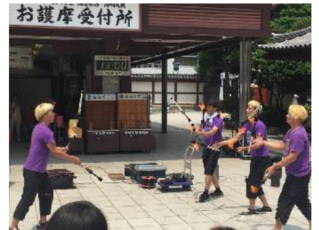
↑日本チャンピオンのパフォーマンスも観られてラッキー! ↓煙をかぶると清々しい気分になります。