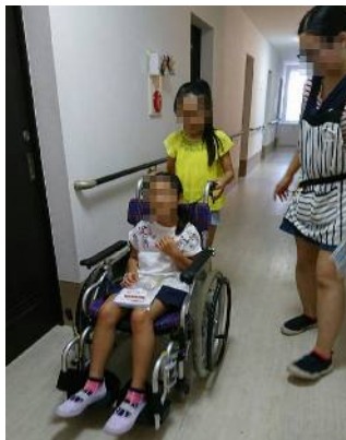
「私にも出来るわ～」操作の基礎を教わり早速車椅子を押してみました。乗ってる方もラッパラッパ(笑)

排泄介助体験では、デリケートな部分の介護として、現場で使われているリハビリパンツや排泄用吸収パッドに触っていただいたり、専門的な話を聞いたりする体験をしてもらいました。「へえ、ほお」と子供たちや保護者の方も驚きの声が聞こえていました。水分補給体験では、暑い時期に必要な脱水症状について説明を受けながら、テレビCMでもおなじみのOS-1(大塚製薬工場:経口補水液)の試飲体験をしてもらいました。脱水症状のポイントや対処法等、すぐに使える知識やアドバイスを真剣に聴き入っていました。介護ベッド体験では、実際に使っているタイプの介護ベッド(電動で頭や足、高さを調整できるもの)を操作したり、寝ていただく体験をしてもらいました。静かにゆっくり動くので、不思議な乗り物みたいと興味津々、普段高齢者の方がどうやって使うのか聞いて、感心された様子でした。全部の体験コーナーを周り終えたあとは、受付で修了証と撮影した写真を記念にプレゼント、キッズ達の嬉しそうな笑顔が入居者様やスタッフに最高のプレゼントになりました。