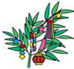
願いを込めた短冊一枚一枚を丁寧に飾っていきましょう。きっと「いいひとにあえますように」の願いも叶います!