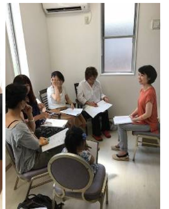
保護者様向けに「認知症林」-ナー養成講座も開催、受講者にはオリジナル「ボナー」の証が!!