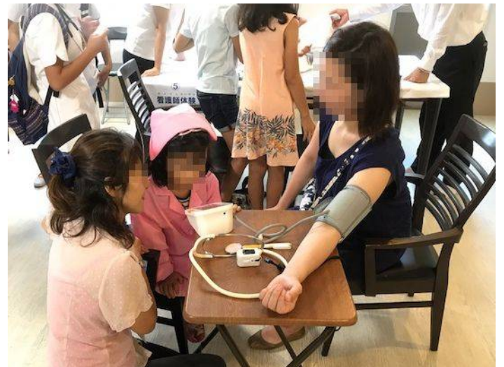
看護師さんと一緒に お母さんの血圧 を測ります。

7月22日、川崎市中原区のグループホーム「バナナ園武蔵小杉」で夏の大型イベント「バナナ園フレンドキッズ<子供職業体験>」が開催されました。この催しは、高齢者の介護に関わる人たちの仕事を子供たちに体験してもらうためのイベントです。グループホームで介護や医療<「看護師」「薬剤師」>の仕事に触れてもらい、働く楽しさを感じたり、入居されている高齢者の方と少しでも触れ合ったり、施設での生活に理解を深めて頂ければと企画されました。この日、会場はたくさんの子供たちで溢れかえり「介護士」「看護師」「薬剤師」「排泄介助」「水分補給」「介護ベッド」の6つの体験コーナーに分かれて行われ、各体験コーナーからは楽しそうに学ぶ声が聞こえました。介護士体験では、自走型、ディルド型(ベッドのように体を寝かせて乗れるもの)、電動型の3種類の車イスと歩行器などに乗ったり、操作して体験をしてもらいました。電動型が一番の人気でした。看護師体験では、実際の白衣を着て、看護師さんと「バイタルチェック」と呼ばれる血圧測定、血中酸素濃度測定、脈拍測定、体温測定の体験をしてもらいました。病院ではなかなか聞けない質問をしたり、初めて触る機械にドキドキした様子で体験をしていました。女の子には白衣を着ての写真撮影が大好評! 薬剤師体験では、ジュースやラムネをお薬に見立てて、薬剤師さんと薬包を作る体験を、ラムネ(錠剤の代用)をすり鉢で粉末にしたり、ジュース(シロップ剤の代用)を計量したりして真剣に取り組んでいました。自分で作った薬は薬袋に入れて記念にお持ち帰りいただきました。