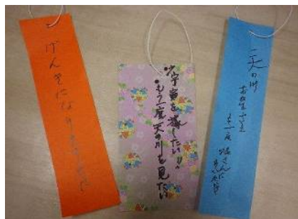
「げんきになりますように」「宇宙を旅したい/もう一度天の川を見たい」「天の川お星様もう一度●さんにあいたい」