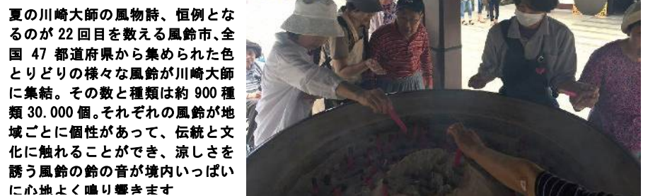
夏の川崎大師の風物詩、恒例となるのが22回目を数える風鈴市、全国47都道府県から集められた色とりどりの様々な風鈴が川崎大師に集結。その数と種類は約900種類30,000個。それぞれの風鈴が地域ごとに個性があって、伝統と文化に触れることができ、涼しさを誘う風鈴の鈴の音が境内いっぱい心地よく鳴り響きます