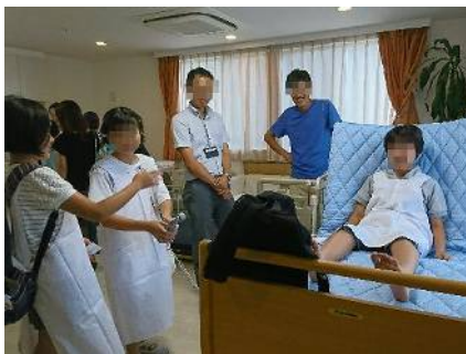
どんどん吸い込む紙パットの吸水力にみんなビックリ!! これなら安心だ!!