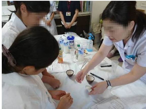
白衣を着ると気分はすっかり薬剤師!! すり鉢で粉末にし薬包作りを学びました。今日の体験で薬学部に進学を決めました(笑)