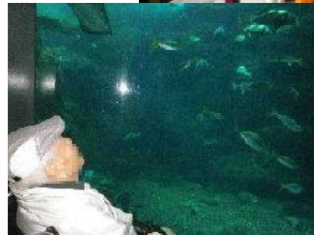
↑イルカのショーに拍手喝采!! 「僕もお魚さんになりたい…」とは言っていないんですけど魚たちのユーモラスな動きに水槽に釘付け。