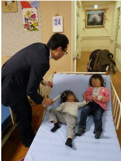
リモコン操作で動く電動ベッドは不思議な乗り物!!全ての職業体験が終わると修了証が授与されます。

看護師体験では、実際の白衣を着て看護師さんと「血圧測定」「血中酸素濃度測定」「脈拍測定」「体温測定」等「バイタルチェック」と呼ばれる体験をしてもらいました、また聴診器を実際に胸に当て「心音」や「呼吸音」を聞いてみると子供たちはすっかりドクターの気分です。子供たちは初めて触る機械にドキドキした様子、また普段はなかなか聞けない質問をしたりと貴重な体験をすることが出来ました。特に女の子には白衣を着てあこがれの看護師さんになりきりの写真撮影が大好評! 薬剤師体験では、ジュースやココアをお薬に見立てて、薬剤師さんと薬包を作る体験を、ラムネ(錠剤の代用)をすり鉢で粉薬にしたり、ジュース(シロップ剤の代用)を計量したりして真剣に取り組んでいました。自分で作った薬は薬袋に入れて記念にお持ち帰りいただきました。水分補給体験では、これからの時期に注意が必要な脱水症状について説明を受けながら、テレビCMでもおなじみのOS-1(大塚製薬工場:経口補水液)の試飲体験をしてもらいました。脱水症状のポイントや対処法等、すぐに使える知識やアドバイスを真剣に聴き入っていました。全部の体験コーナーを周り終えたあとは、受付で修了証と撮影した写真、記念品をプレゼントされました。そしてキッズ達の嬉しそうな笑顔が入居者様やスタッフに最高のプレゼントになりました。