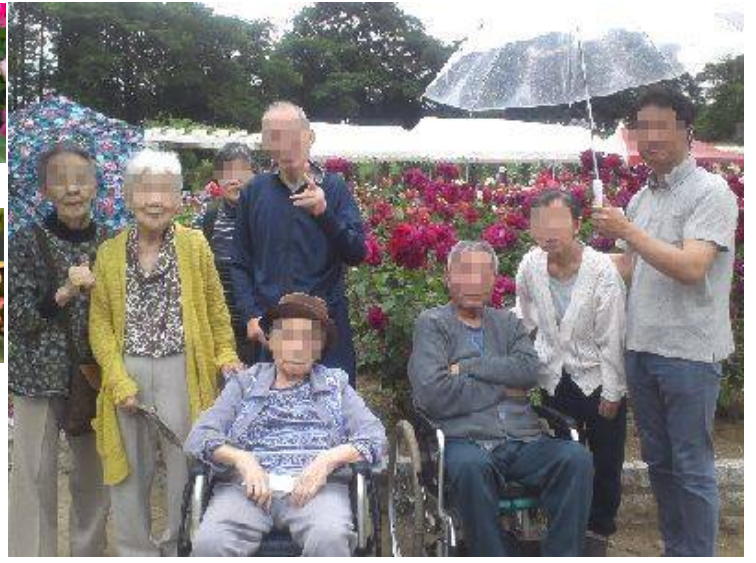
生田緑地ばら苑へは「小田急向ヶ丘遊園」南口から徒歩20分、バス利用の場合は「藤子・F・不二雄ミュージアム」バス停下車。秋季にも440種類・4000株のバラが楽しめる。苑内売店の「ハワイ」「パジャニス」も人気!!