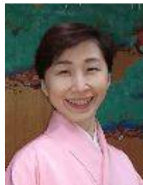
皆さんやはり作るより食べるほうがお好きなようです。庭にはがけつぎが咲いています