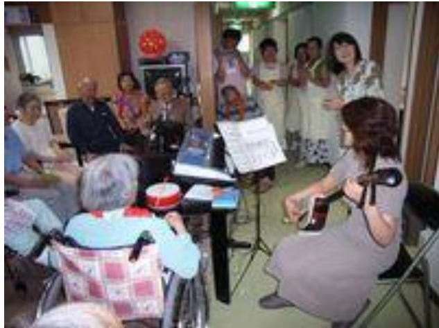
前回の音楽療法です

いつも、座ってばかり、うろうろしてばかりだと、自分が判らなくなってしまったりするのでしょうが、音楽療法を受けると元気で働いていた頃の自分に戻ったような気持ちを取りもどすのかなあ・・・とも考えています。「音楽療法」はこれまで多くの研究がなされており、学術論文も発表されてきた分野で、高齢者に限らず様々な医療現場に取り入れられていると言います。ガッツポーズ、ハイタッチ、スキップ・・・こんな行動が入居者に頻繁に見られるといいな、と思い、一人にやけた、そんな音楽療法の成果でした。