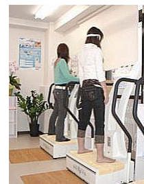
マシンに乗るだけ！