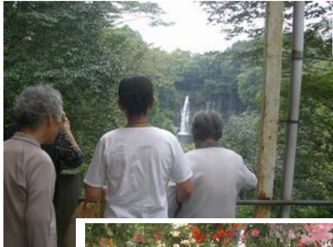
白糸の滝にウツトリ

9月26、27日にわたり、バナナ園グループでは各施設入居者の皆さんから希望者を募り、富士休暇村<静岡県富士宮市>への一泊旅行を実施。バナナ園グループの各施設では日帰りの小旅行等は実施しているものの、安全確保やスケジュールの面から皆さんを連れての宿泊旅行となるとなかなか実行に移せなかった。しかし日頃から入居者の皆さんからの「もう一度富士山が見たい」「温泉にゆっくりつかりたい」といった願いを聞いているスタッフ達の発案によりこの旅行会が実施されることになった。当日は入居者の皆さん7名、看護師を含むスタッフ16名、計23名が参加、バスをチャーターし午後一番に川崎を出発、「白糸の滝」に立ち寄り、休暇村富士に到着。全員で夕餉を囲み入居者の皆さん待望の入浴、スタッフは汗水流しながら慣れぬお風呂で入浴の介助。翌日は「富士国際花園」で色とりどりのペゴニア鑑賞、大輪のペゴニアにはため息さえも、更に「まかいの牧場」を周り事故も無く無事一泊旅行は終了した。スタッフは「とにかく安全確保を第一に考えながら慣れない場所でのお世話は想像以上に大変で緊張の連続、私たちは風景やお食事を楽しむ余裕はなかったが、普段は見ることの出来ない入居者の皆さんの笑顔は疲れを癒してくれる素敵なものでした」「入居者の皆さんの希望と想い出作りに一役買うことが出来たと思う、これも介護の重要な仕事」と感慨深げ。今回は残念ながら曇り空、富士山の全景を楽しむことはできなかったが、入居者の皆さんは一様に大満足、逆に「次こそは富士山を拝みたい、しっかり長生きしたい」と新たな励みにもなったようだ。