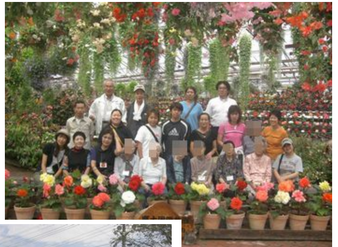
お花に囲まれて全員で記念写真<富士国際花園>