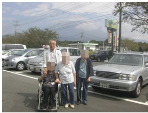
うっすらと雲のかかった富士山ですが思わずブイサイン！