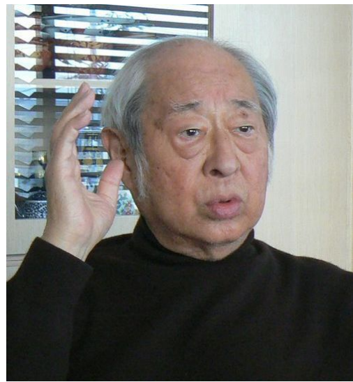
介護について語る長門さんの真剣な表情は本当に印象的でした