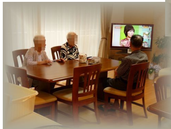
↑リビングルームは入居者様の集いの場所、テレビを見ながら会話も弾む自室でくつろぐ入居者様→