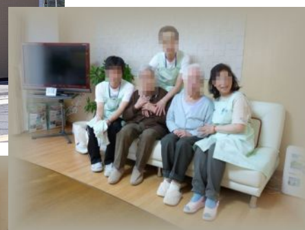
↑スタッフとも家族のように仲良くなりました