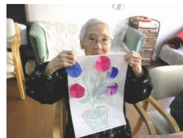
←ステキなオブジェが出来あがりました、キレイですね。

デイサービスはここ最近増えましたが、少人数のご利用者様を経験豊かなスタッフがしっかりとサポートをして、新しいサービスや技術の導入を進めているデイサービスはそれほど多くありません。仕事が増えても、忙しくなってもご利用者様最優先の姿勢こそがデイサービス・バナナ園の特徴かもしれません。ご利用者様からも「毎週デイサービスに行く日が楽しみなのよ: 90代独居女性」「お風呂に安心して入れるから昨日から楽しみでしたよ: 90代女性」「お友達ができおしゃべりするのが好き。家にいると一日だれとも口をきかないんだもの: 70代女性」「車で迎えに来てくれてドライブするから楽しいわ: 80代女性」や「バナナ園のデイサービスに行くようになってから父が元気になって会話も増えて笑顔になったんです: ご家族60代男性(ご利用者様90代男性)」とのコメントを頂いています。