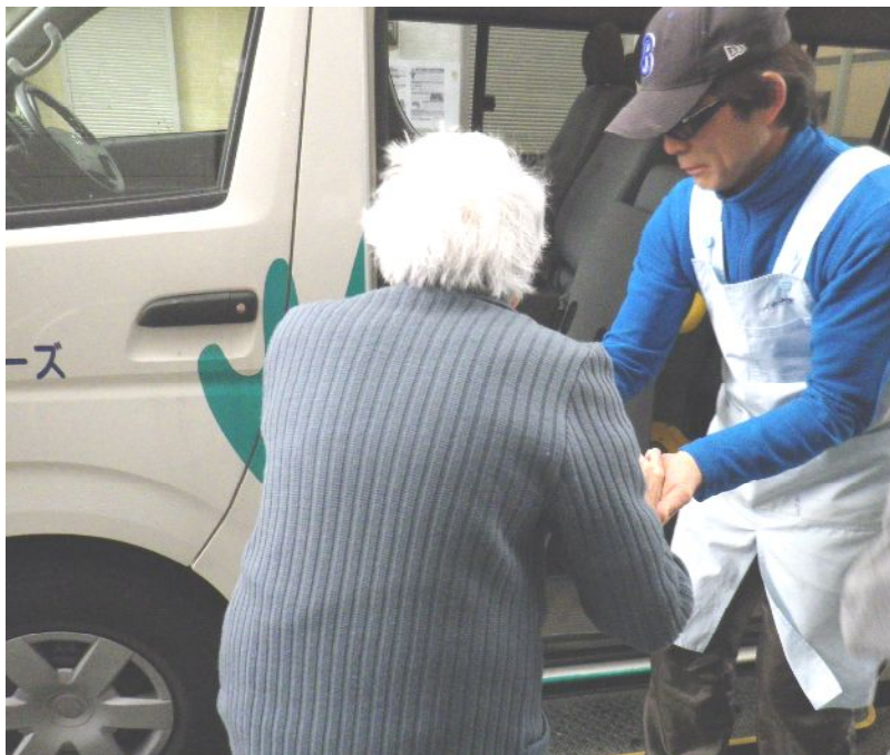
オープンから8年施設でも送迎でも無事故が私達の自慢です!