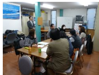
↑管理者クラスのリーダー研修 福祉用具・介護研修→ 市内のホテルで開催される豪華なクリスマスパーティー