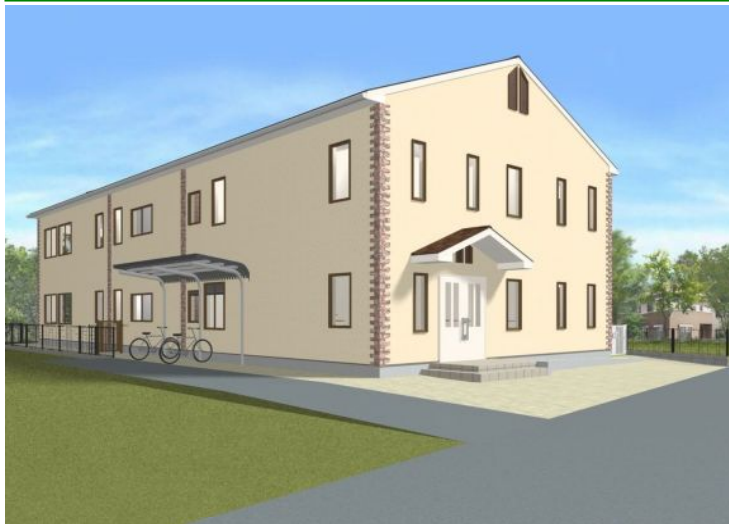
6月オープン予定のバナナ園武蔵小杉<完成予想図>

バナナ園グループ<㈱アイ・ディ・エス/社会福祉法人バナナ会>では、今年二つのグループホーム<「バナナ園武蔵小杉(2013年6月OPEN予定:㈱アイ・ディ・エス)」「のんびり〜すII(2013年10月OPEN予定:社会福祉法人バナナ会)」>のオープンに向け、従業員、スタッフの大募集を行います。地元に着目しグループホーム運営を中心に認知症介護に特化し15年、バナナ園のスタッフになれば数々の研修システムによって働きながら介護スキルの向上もバッチリ!! 介護のスキルは実際にご利用者様、ご入居者様と接して初めて向上します、頼れる先輩職員のもとで働きながらしっかり学べるバナナ園グループで介護のプロフェッショナルを目指しましょう! 入社時の<オリエンテーション>から配属後の<新人研修>は勿論、現任になっても定期的な<現任研修>でスキルをブラッシュアップ。更に個人のモチベーションアップのために<コーチング>のシステムも導入しています。更に<研修手当>もあるので、非常勤の方でも安心して学べます。また資格取得<介護福祉士、介護支援専門員(ケアマネジャー)>時にはお祝い金も。福利厚生システムも超充実!! 「健康保険」「厚生年金」への加入は安心の証。「有給休暇制度」も完備!更に「永年勤続制度」「資格取得お祝い金制度」も充実。「社内研修旅行」や全社員の集う「クリスマスパーティー」などの社内行事も盛んです!更にうれしいのは国内大手の福利厚生代行会社「リポートソリューション」と契約しているから「ライフサポート倶楽部」運営のホム・別荘・ゴルフ場から生活サポートまで、多彩な施設を使い放題(有料)!! 家族や恋人と過ごす余暇の充実もバナナ園ならバッチリです。