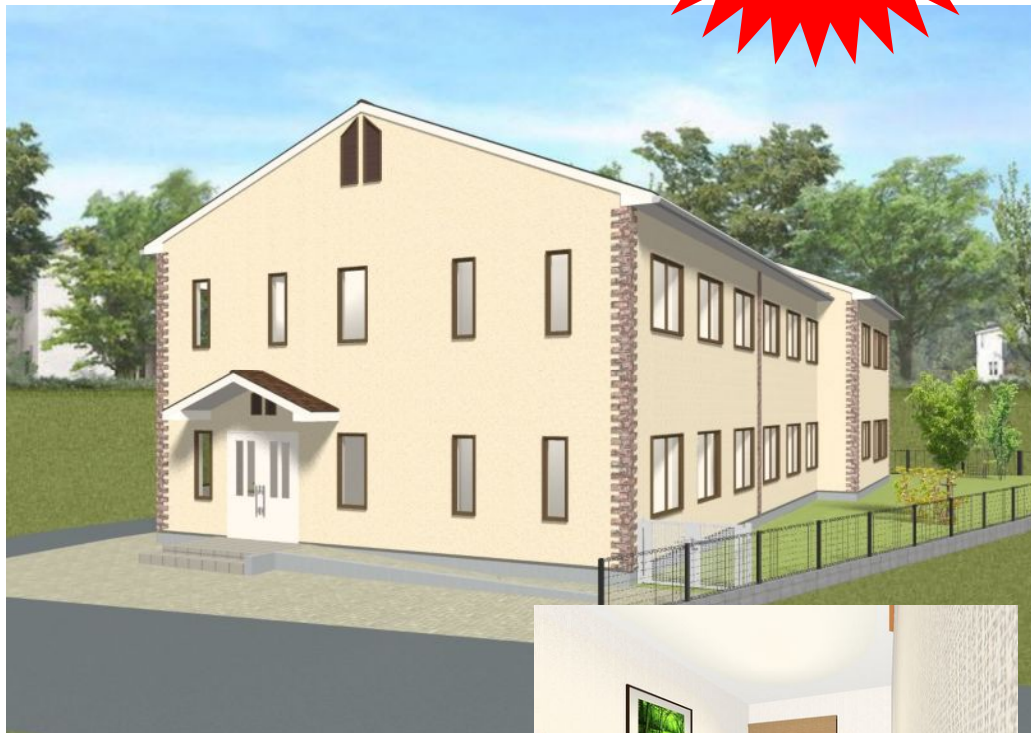
↑憧れの都市「武蔵小杉新南口からわずか徒歩14分」駅前の賑やかさからは創造できない緑に囲まれた環境に瀟洒な建物「武蔵小杉バナナ園」。