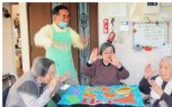
バンザイやった! 遂に完