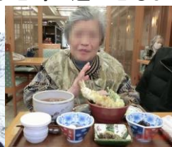
これが噂のお花見御膳<正式には天ぷら御膳>