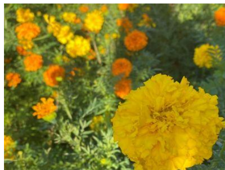
あいみよんのヒット曲にもあるマリーゴールドは雑草の一年草で、鮮やかな黄色やオレンジの花を長期間次々と咲かせます。栽培も容易なので、関東では夏～初冬まで花壇の定番目ともいえるポピュラーな花です。