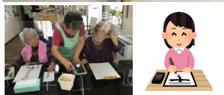
第2バナナ園の書道クラブはスタッフが師範の無手勝流!!リハビリ効果よりその時間を楽しんで頂くためのイベントです。