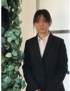
S.M.さん 2020 年入社、沖縄キリスト教短期大学卒。沖縄県出身、短大卒 2 年目なので今回のマイナビでは一番の若手