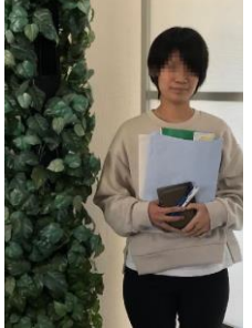
E.I.さん 2016 年入社、フェリス女子学院大学卒。総合職 1 期生。昨年見事に国家資格、介護福祉士の試験に合格！

学生から社会人になると、やはり自由になる時間は制限されてくる。全員に共通の課題はお金よりも時間。「7 時間勤務、17 時終業後の時間を如何に上手に使うかが鍵」と言うのが先輩総合職からのアドバイス。逆に就活生の皆さんには「学生時代の“今”を大切にほしい」