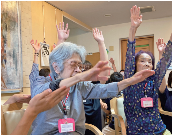
▲バナトレの準備運動「ふるさと」に合わせて体操を行なう入居者様