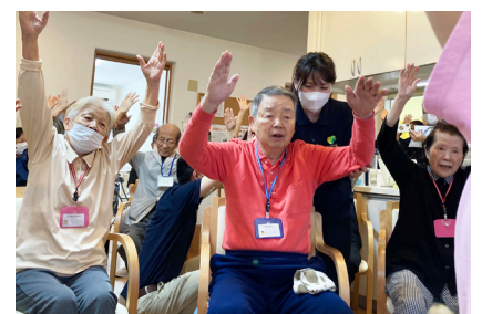
▲もちろん性別に関わらず身体機能の低下予防につながる運動も含まれています