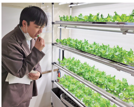
▲水耕栽培のレタスに興味津々