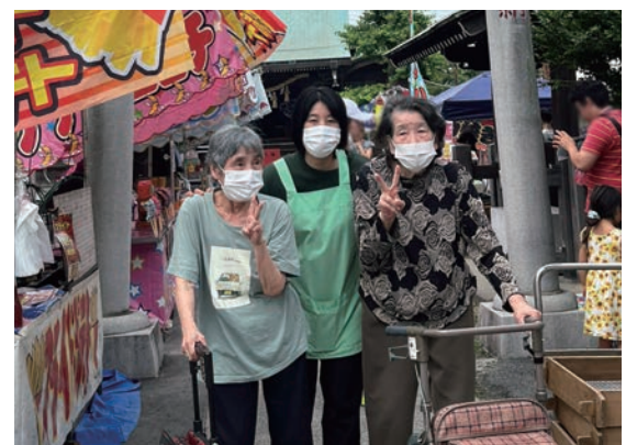
▲ 小倉神社の朝市へお出かけ