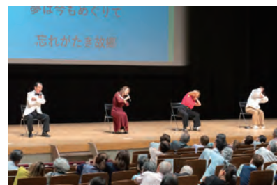
▲ 会場全体で「ふるさと体操」